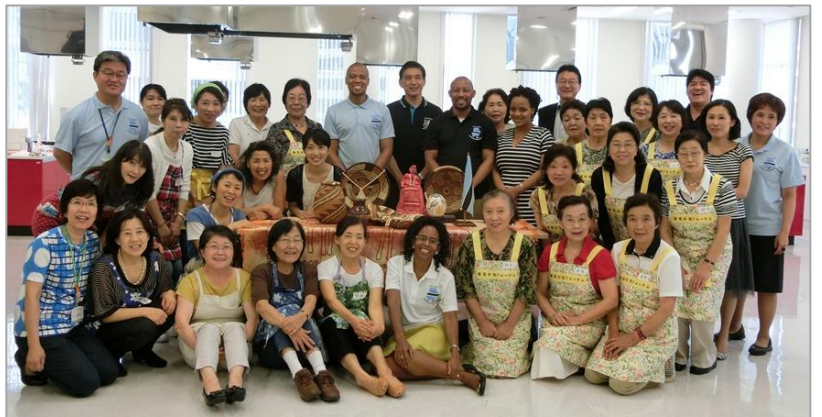
ボツワナ大使館員、都筑区長も参加者とともに記念撮影。