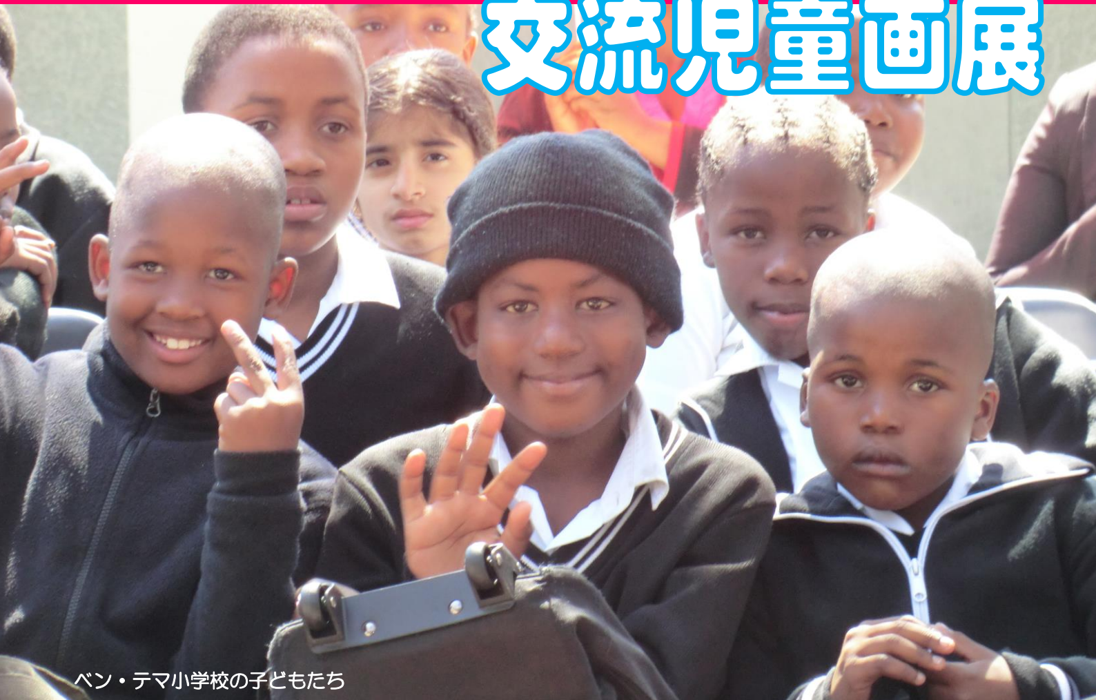
ベン・テマ小学校の子どもたち