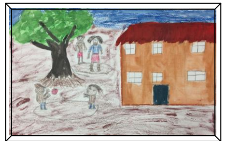
学校の休み時間や放課後には校庭で色々な遊びをします。