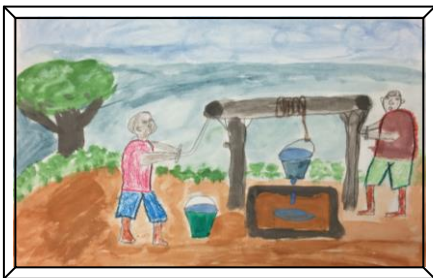
男の子たちは井戸に水を汲みに行っていました。

3月2日(土)~28日(木) JICA 横浜にて、茅ヶ崎小学校とボツワナのベン・テマ小学校3年生の絵を233点展示します。ボツワナの子どもの絵からは、遠く離れたアフリカの暮らしが伝わります。