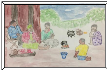
子どもたちは祖父母と一緒に火を囲んでおばあちゃんの昔話を聴いています。