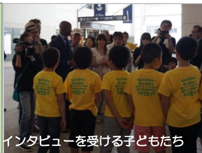
インタビューを受ける子どもたち