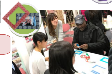
ボツワナ(フォトフレーム)