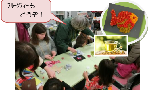
ドイツ (クヌベルフィッシュ)