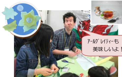
ウェールズ(フェルトの花作り)