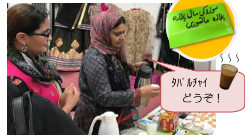
パキスタン (チャイ)

来場者でにぎわうクラフト&ティーコーナー。多くの来場者に国ごとのクラフトやお茶を楽しんでもらいました。