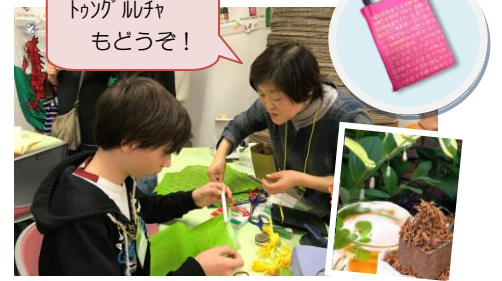
韓国 (韓紙のバッグ)