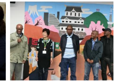
ボツワナからのお客さま