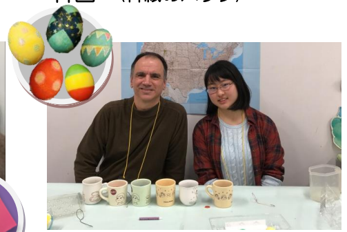
アメリカ (イースターエッグ)