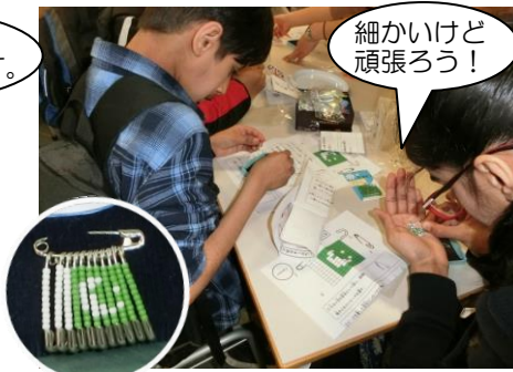
安全ピンビーズ国旗ブローチ