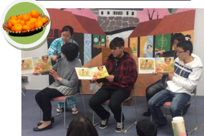
多言語おはなし会

観て・聞いて・感じるステージでした！ ミニステージの背景は中川中学校美術部の皆さんが描いてくれました。