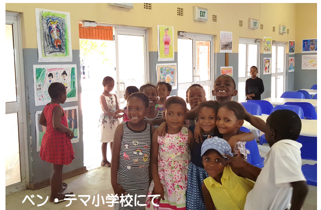
ベン・テマ小学校にて