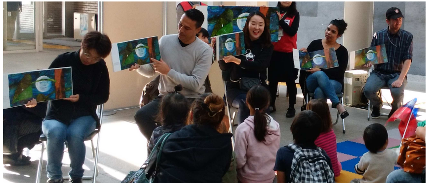
日本語、イタリア語、韓国語、ヒンディー語、英語での読み聞かせ

11月15日(水)に東山田中学校2年生3人がMYプラザで職場体験をしました。開館準備の掃除から始まり、日本語教室への参加、外国につながる子どもたちの教材整理、講座で使う冊子の製本作業をし、最後に一日を振り返りました。外国人と日本語を勉強する事が一番印象的だったようです。3人共、時に連携しながら工夫して、仕事に取り組みました。