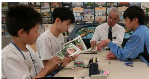
週末の講座で配布する冊子の製本作業