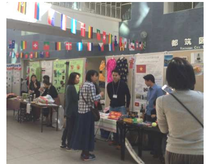
日本を含む10か国が出演

11月5日(日)に都筑区役所1階区民ホールにて、第15回つづき国際交流 Café が開催されました。おはなし広場で『とりかえっこ』を3言語で、『はらぺこあおむし』を5言語で読み聞かせし、言葉の音の違いを楽しんでいただきました。