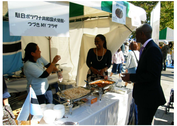
ンコロイ駐日ボツワナ大使も区民まつりのオープニングから参加。ブースにも寄られました。