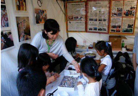
雑誌などから作ったペーパービーズで制作