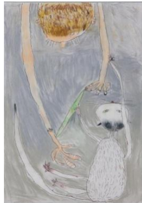
大賞「猫と遊ぶ」 オルドリッチ・ポール チェコ 6歳 男子