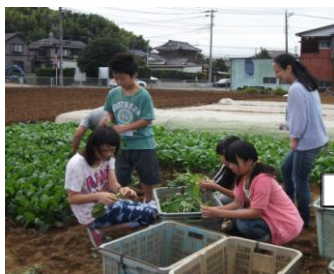
① 小松菜の収穫体験