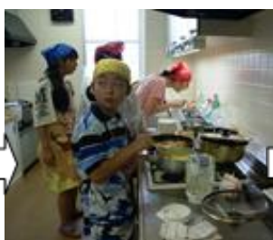
② 料理の試作とレシピの検討