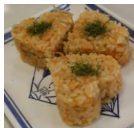
ニンジンじゃこごはん