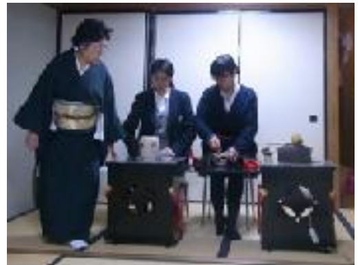
御園棚で立礼のお点前のお稽古中