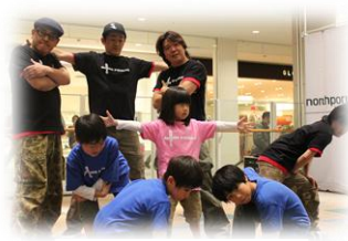
パパ&キッズ ブレイクダンス