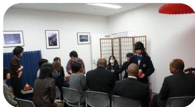
初めての お抹茶体験