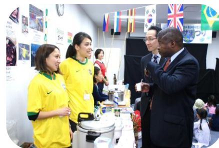
世界の食文化を体験