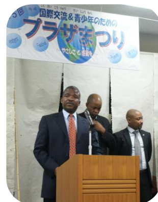
「ボツワナと日本の友好を 深めていきたい」と 大使からのメッセージ