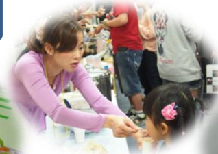
世界 9 国の 手作り料理を 味わいました。