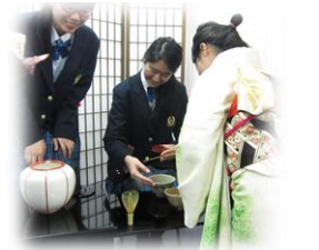
新栄高校茶道部による 抹茶体験