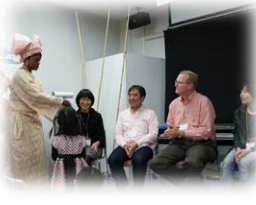
ナイジェリアの遊び