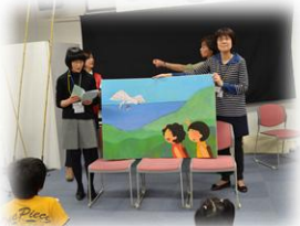
大きな絵本の読み聞かせ