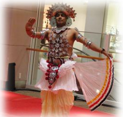
スリランカ伝統舞踊