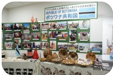
ボツワナの暮らしを紹介

2013年6月1日から3日まで、第5回アフリカ開発会議が横浜で開かれます。 今年のプラザまつりでは、関連企画としてボツワナの写真展を同時開催しました。会場には、 ボツワナの大使や書記官の方々、都筑区長も来館され、日本の伝統文化なども体験されました。