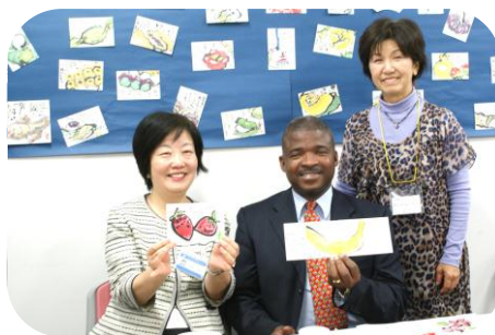
区長と共に絵手紙にチャレンジ