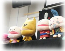
人形劇 mocomoco 「大きなかぶ」