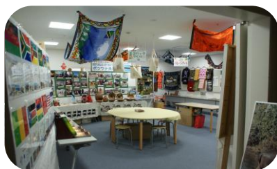
アフリカの国旗パネル展