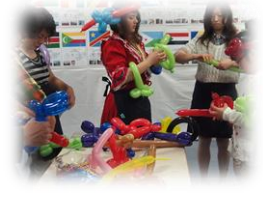
KANJI クラブ バルーンアート