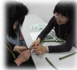
沖縄の伝統工芸 かみつき蛇