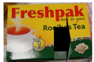
ボツワナ (ルイボスティー) ↑ 原料はアフリカ南部のセダルバーグ山脈でしか採れない植物。