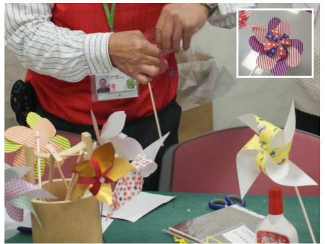
かざぐるま 5枚羽や八重の少し変わったかざぐるまはクルクルよく回ります！