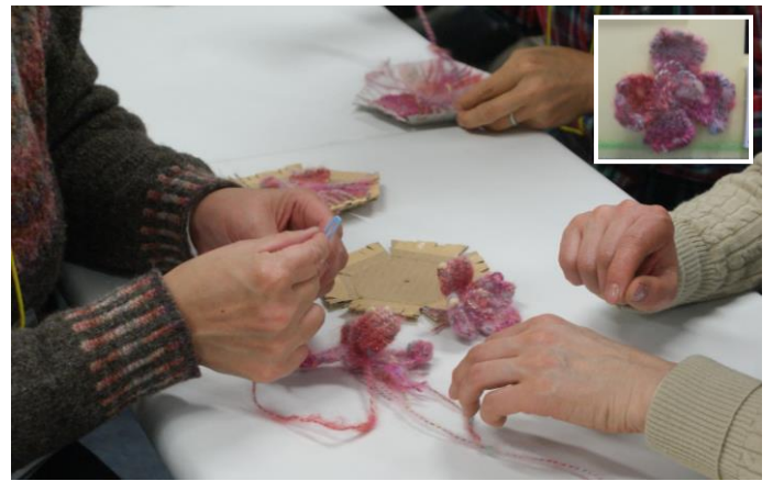
スウェーデン・コサージュ 切れ込みの入った厚紙に、毛糸を巻いていくという独特な手法に皆さん夢中！