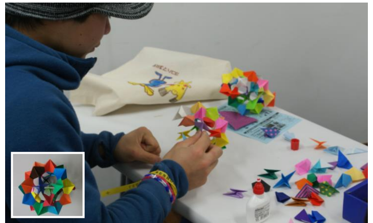
3D折り紙 30ものパーツを組み合わせていくと、だんだん立体的になっていく作品に感動！

ドネーションコーナー 皆様からの献品を販売させていただきました。日本では手に入らない物などバリエーションにとんだ品が揃いました。集まった収益金はプラザのより良い施設運営のために使わせていただきます。皆様のご協力ありがとうございました！