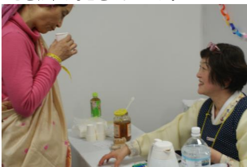
韓国 (ゆず茶) 希望者にはしょうがも入れてスパイシーなゆず茶にもチャレンジしていただきました。