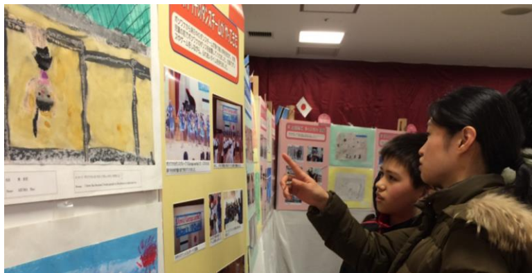
都筑・ボツワナ交流児童画展 茅ヶ崎小学校とバン・テマ小学校の児童が、お互いの普段の暮らしを描いた絵を通して交流しました。その軌跡をパネルにし、児童画とともに展示しました。