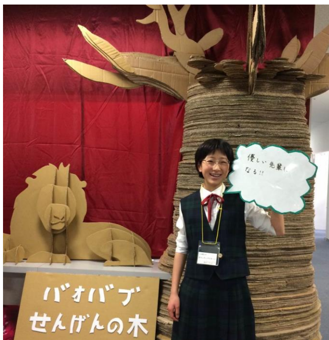
宣言の木 段ボール 400 枚以上で作ったバオバブの木の前で『やさしい先輩になる!!』と宣言する、ボランティアに来てくれた中学 1 年生。 (段ボール提供：ユニクロ港北ノースポート・モール店)

3月8日(日)に2階センターコートとプラザ全館を使って『第7回国際交流と青少年のためのプラザまつり～やさしさと感動を～』を開催し、多くの方にお楽しみいただきました。当日ボランティアや江戸撮影処の背景画制作、段ボールアート制作、センターコート出演などで多くの中高大生、外国人、市民団体、企業などにご協力いただきました。ありがとうございました。