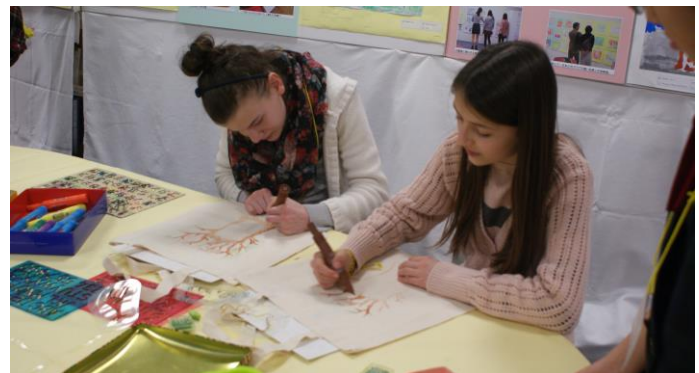
エコバッグ 都筑区役所の協力でポツワナをテーマに バオバブの木をステンシルしたエコバッグを用意。100人 の方が世界で一つだけのマイバッグを作りました。