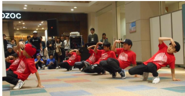
YCB (2階センターコート) キッズから大人まで、エネルギッ シュなパフォーマンスで観客を沸かせました。