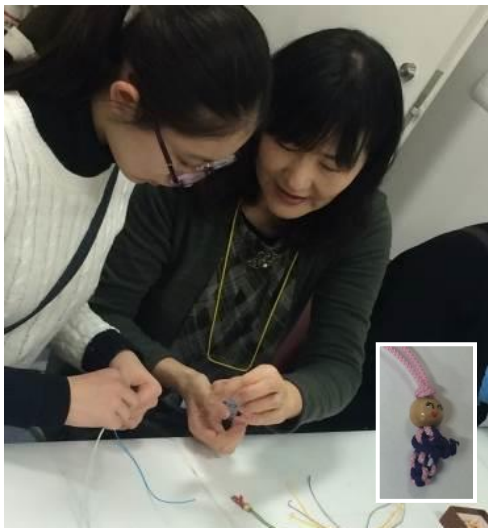
韓国・メドゥプ 韓国の飾り結びで作るこけし人形はストラップにもなり、使うのが楽しみ！