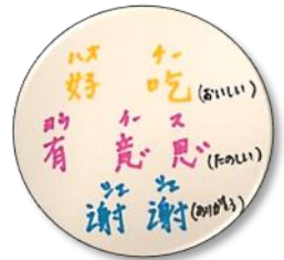
各国のコースター お茶を担当していただいた各国の方に、お国の言葉をコースターに書いていただきました。来場者の方には、各国の言葉で会話も楽しんでいただきました。