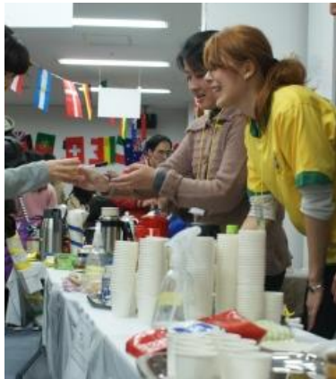
ブラジル (コーヒー) (カシューナッツジュース) 美味しいコーヒーとさわやかな甘さのジュース。