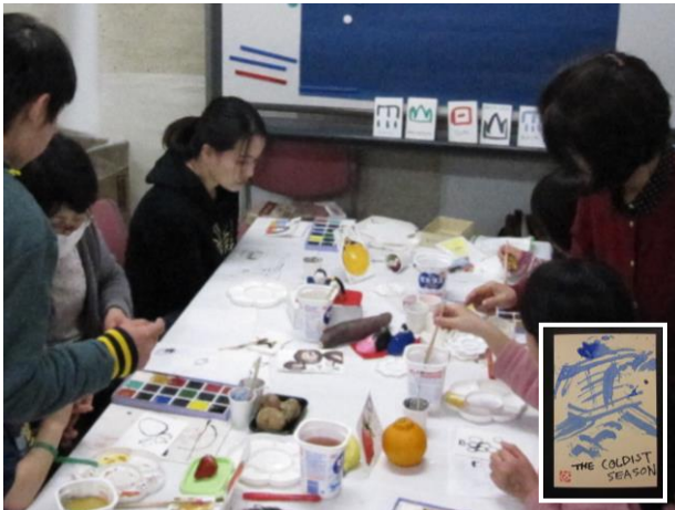
絵手紙 好きなモチーフを絵具などで描き、それぞれ個性豊かな作品ばかり！