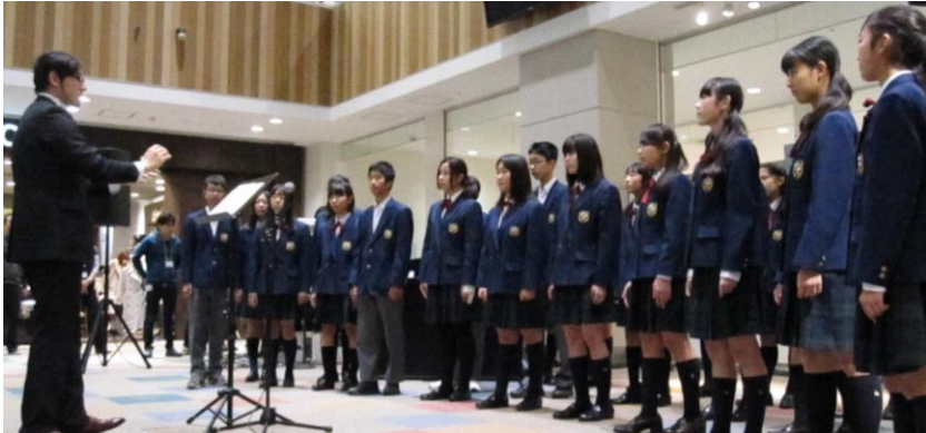
中川西中学校合唱部 (2階センターコート) 2年生20名、1年生 13名が部活動での練習の成果を披露!