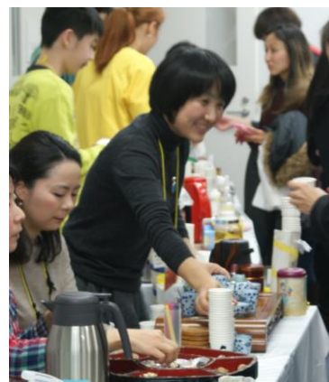
中国 (ウーロン茶) 香りも楽しみながら一口サイズのお菓子も一緒にいただきました。