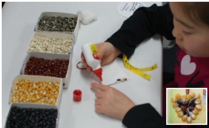
ドイツ・オーナメント 豆や木の実などを使って、どんなデザインにするか考えながらの作業はとても楽しそう！