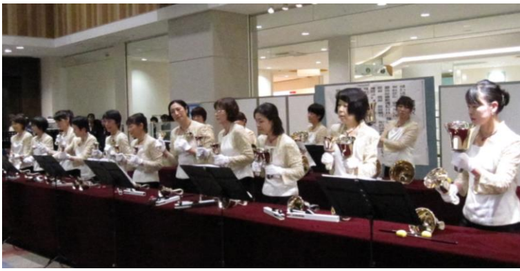
Erba (2階センターコート) センターコートのオープニング。 優しい音色に皆さん引き付けられました。