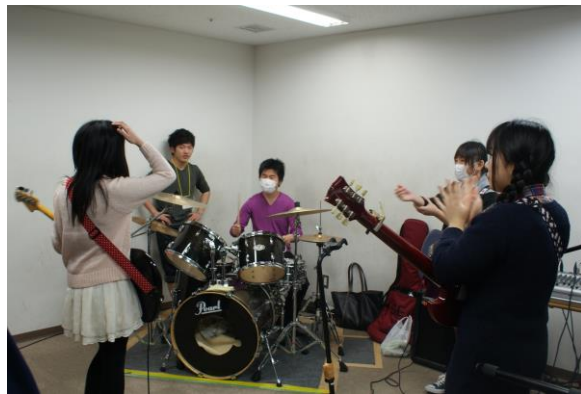
バンド体験 『BACKFLOW』（高校生バンド）と『東京都市大学音楽団体 PLAM』（大学生バンド）がやさしくドラムの指導。