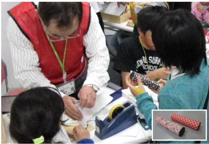
万華鏡 「わあ〜きれい！」出来上がった、世界に一つだけの万華鏡をのぞいて目が輝きます！