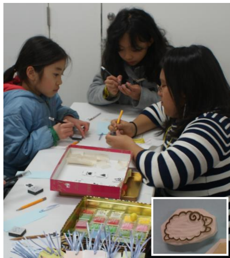
消しゴムハンコ 彫っている時は、怪我をしないように皆さん集中！