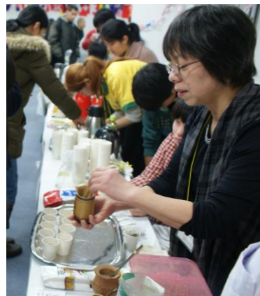
アルゼンチン (マテ茶) 伝統的な茶器は、ひょうたんからできています。