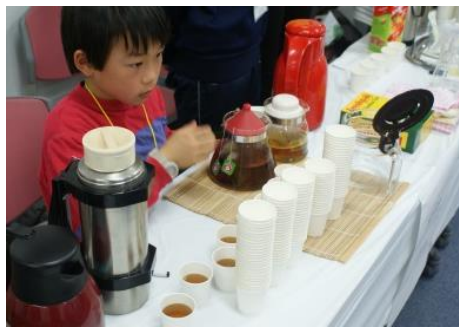
ドイツ (ハーブティー) ペパーミントリーフとカモミールフラワーのお茶で、皆さんリラックス。