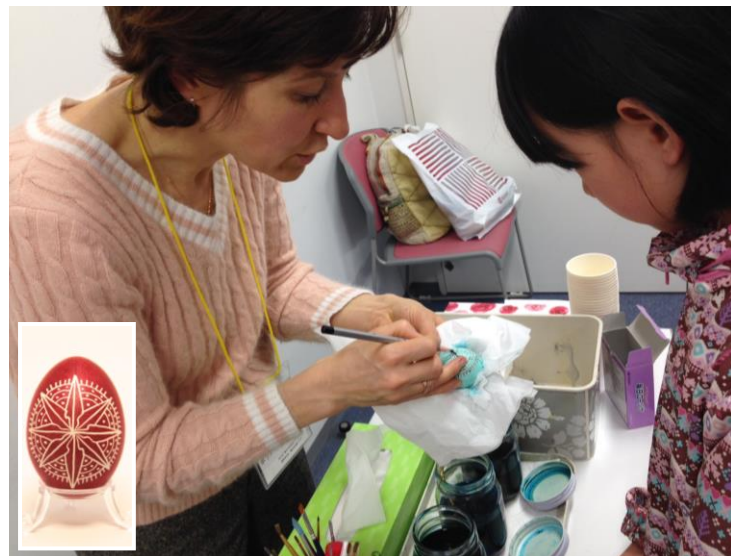
ウクライナ・ピサンキ ウクライナの伝統的なろうけつ染めのエッグアート。繊細な作業ですが、この貴重な体験に皆さん真剣な表情！