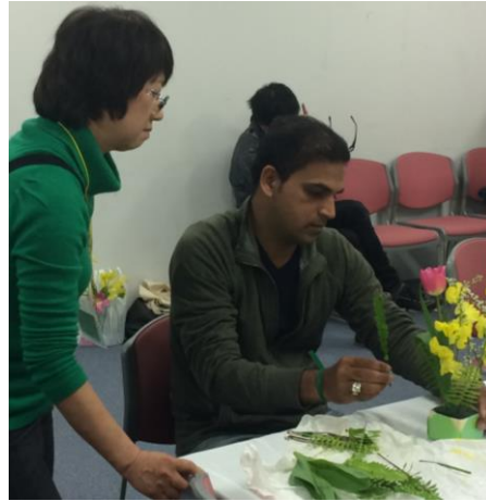
生け花 毎年大好評の生け花は、今年も用意した花が直ぐ完売！