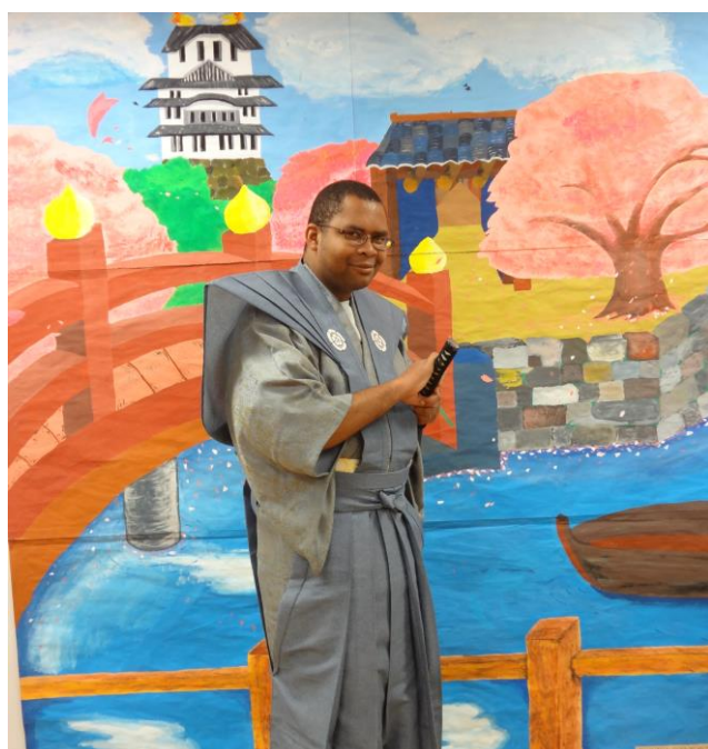
江戸撮影処 荏田南中学校美術部作の江戸城と日本橋をバックに袴に身を包みポーズを決める参加者。江戸にタイムスリップ。刀を手にニヤリとご機嫌な笑顔。 (着物提供：日本舞踊教室都伎の会)