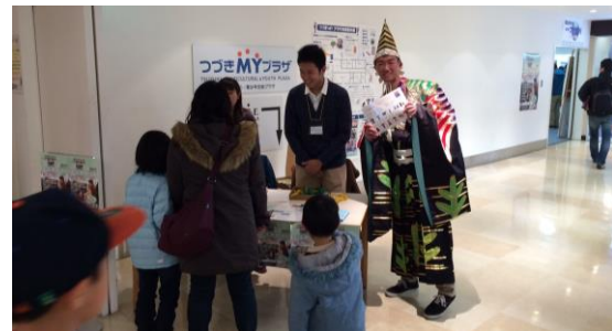
受付 高校生や 大学生が積極的 に受付を担当し てくれました。 自分自身も江戸 の衣装に身を包 みながらポラン ティアしてくれ ました。