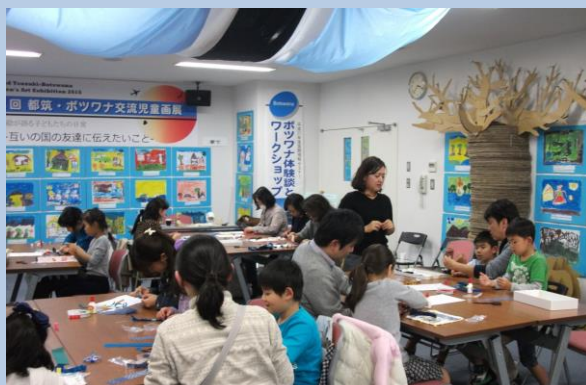
ポツワナの女性と一緒に作っていたアクセサリを現地の生地(ジャーマンプリント)を使って作りました。