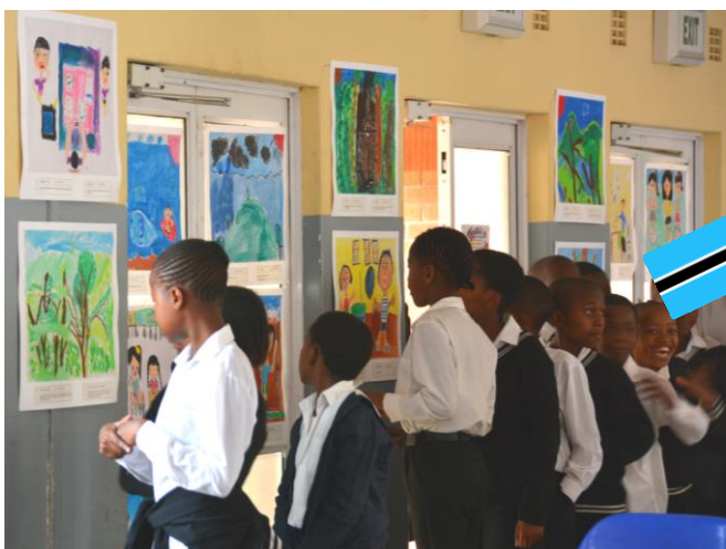
茅ヶ崎小学校の絵を、興味津々で鑑賞するベン・テマ小学校の子どもたち。

11月17日から23日まで『都筑・ポツワナ交流児童画展』を開催しました。まず、遠く離れたアフリカのポツワナ共和国のお友だちに、日本の暮らしを伝えようと137枚の茅ヶ崎小学校の3年生の絵が海を渡りました。そして、今回、ポツワナから帰ってきた137枚の絵とともにポツワナのベン・テマ小学校3年生の絵116枚と写真を展示し、お互いの国のことを来場者にも感じていただきました。