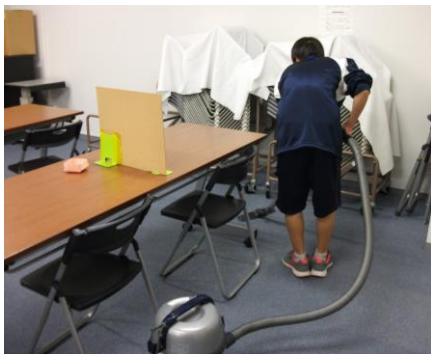
朝の開館準備。一日の始まりの大事な仕事です。

11月12日に都田中学校2年生2人がプラザの仕事体験しました。一日を振り返って、「はじめは、どういう仕事か不安でもあり、楽しみでもありましたが、社会に重要な貴重な経験をしました。」「外国の方と長時間、話すのは初めてでした。戸惑いましたがお話ができてうれしかったです。」「知らないことを知る楽しさがありました。」などの感想がありました。利用者も中学生が頑張る姿にすがすがしさを感じていたようです。