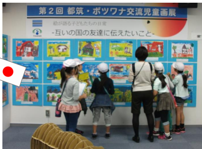
ベン・テマ小学校の絵をメモを取りながら、真剣に観る茅ヶ崎小学校の子どもたち。