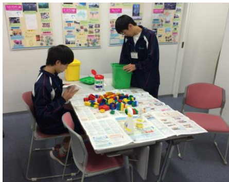
保育などで使うおもちゃをきれいに拭きました。