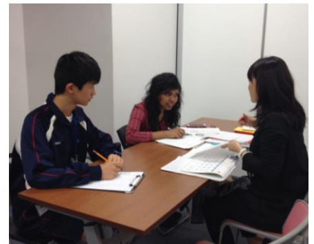
日本語初級者のインドの学習者と一緒に勉強しました。