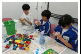
保育用おもちゃの清掃