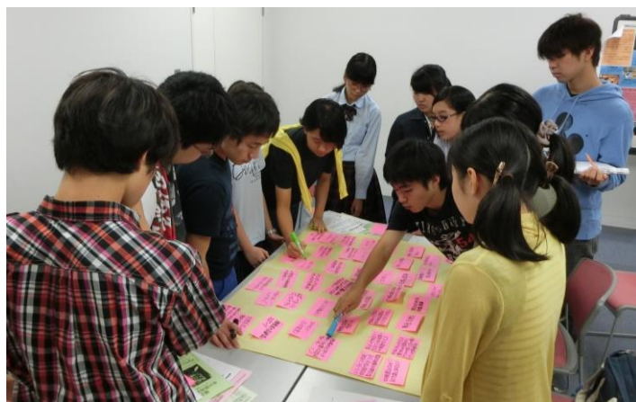
知恵をしぼって、アイデアを出し合いました

「はあと de ボランティア」体験者が、自分たちでボランティアプログラムを企画します。今年度は22名が「やってみたい！」と手を挙げ、9月25日の第1回ミーティングには12名が参加しました。緊張して座っていた新メンバーに経験者が声をかけて、「どんなボランティアをやってみたいか、何ができるか」みんなが積極的に意見を出しあいました。これから時間をかけて、地域を知り、地域のために地域の中でどんな活動が生まれるのか楽しみです。