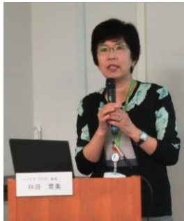
「日本語ボランティアとは」

今年は10月19、20、21日に開催して21名の方が受講され、基本的な心構えや教え方を学び、実際の教室を見学しました。次はあなたもこの講座を受講して、ボランティアとしての一歩を踏み出してみませんか。