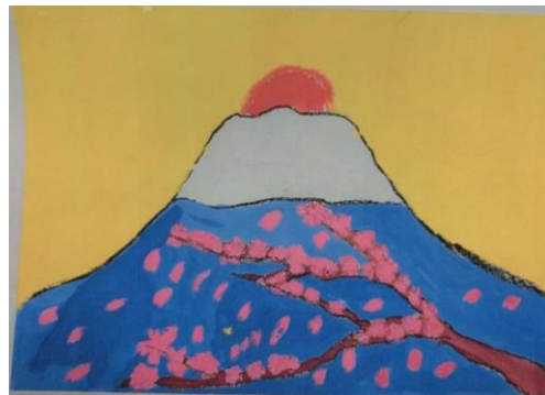
『ふじ山と桜』茅ヶ崎小3年生

両国の児童画が、今度は13,600km離れた日本に戻ってきました。会場では、ベン・テマ小学校の児童画展の様子の写真や動画がご覧いただけます。