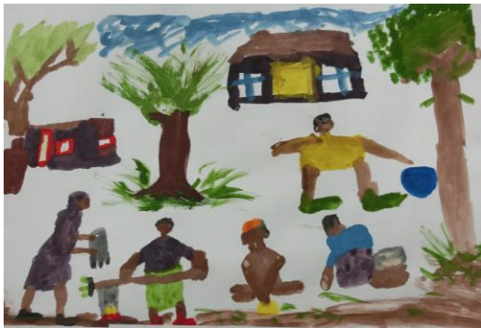
『家での毎日の様子』ベン・テマ小3年生

11月14日（月）から20日（日）に、『第3回都筑・ボツワナ交流児童画展』を開催します。9月には、茅ヶ崎小学校の児童画がボツワナ共和国に渡り、ベン・テマ小学校とタポンビジュアルアートセンターで展示されました。両国の児童画が、今度は13,600km離れた日本に戻ってきました。