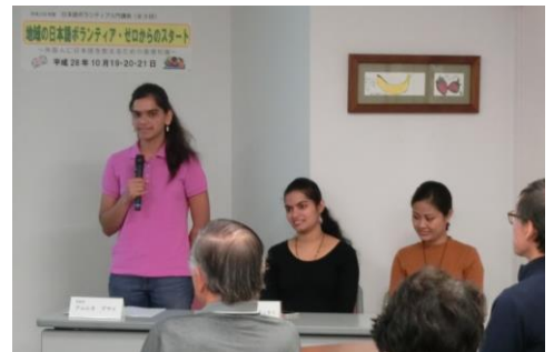
MYプラザで学ぶ学習者が成果を披露