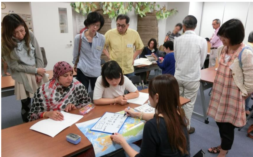
受講者が日本語クラスを見学