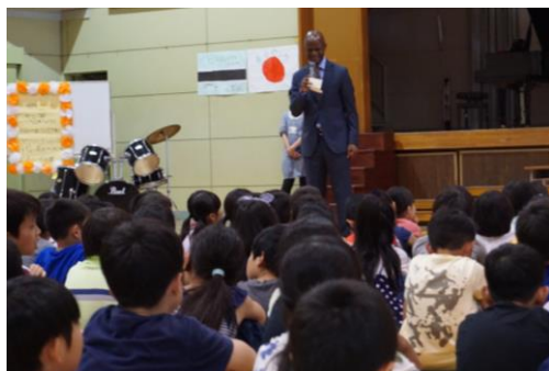
体育館でポツワナの紹介をするンコロイ大使

7月6日、駐日ポツワナ共和国ンコロイ大使を茅ヶ崎小学校にお招きし、3年生の国際理解教室を実施しました。子どもたちは手作りのアーチや歌で大使を歓迎し、大使も子どもたちと写真を撮るなど、活気あふれる楽しい交流となりました。食べ物や言葉など、日本とは異なる文化に興味深く学んだ子どもたちは、ポツワナの小学生たちに