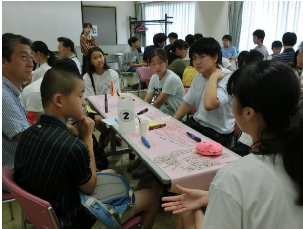
「やっぱり楽しみのなつてきた」