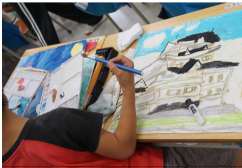
「日本の何を伝えようかな…」

日本のことを伝える絵の制作に取りかかりました。富士山、着物、将棋…思い思いの「日本」が描かれた絵は、海を越えて遙か遠いポツワナの小学校に送られます。第5回児童画交流の幕開けです。