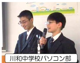
川和中学校パソコン部