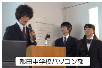
都田中学校パソコン部