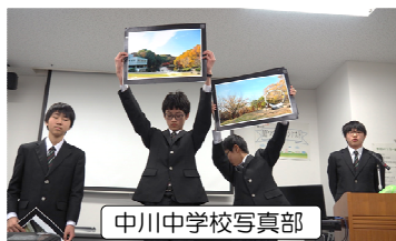
中川中学校写真部

12月16日(日)、『第6回MYつづき一番コンテスト』を開催しました。区内の中学生が、「都筑区のここが一番！」と思う人、もの、場所などを取材し、映像や写真などを使って紹介するものです。今回は区内5つの中学校から7作品がエントリーされ、作品の出来栄とプレゼンテーションを競いました。「作品づくりをとおして地域とのつながりを感じ、自分たちが住むまちを好きになって欲しい」と願う地域の方々を、審査員としてお招きしました。