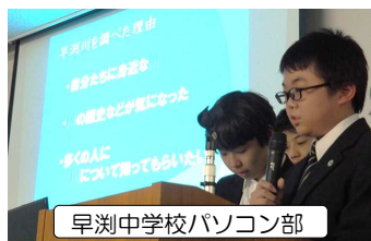
早淵中学校パソコン部