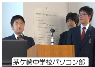
茅ヶ崎中学校パソコン部