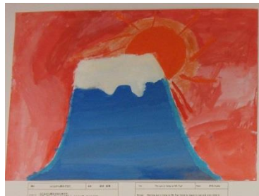
ベン・テマ小学校と茅ヶ崎小学校の児童画