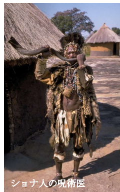
シヨナ人の呪術医