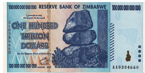
100兆ジンバブエドル紙幣