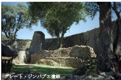
グレート・ジンバブエ遺跡