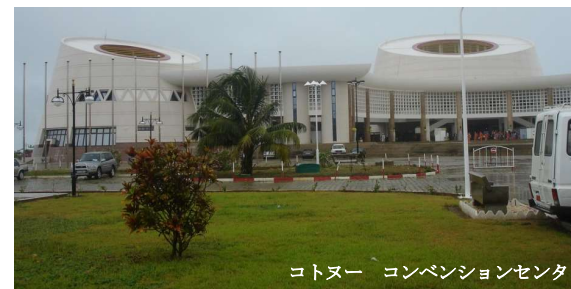
コトヌー コンベンションセンタ