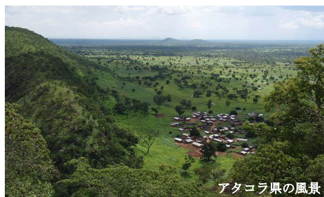
アタコラ県の風景