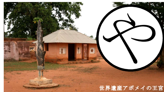
世界遺産アボメイの王宮