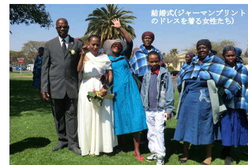
結婚式(ジャーマンプリントのドレスを着る女性たち)