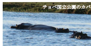
チヨベ国立公園のカバ