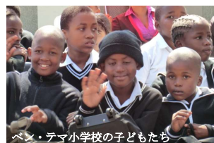
ベン・テマ小学校の子どもたち