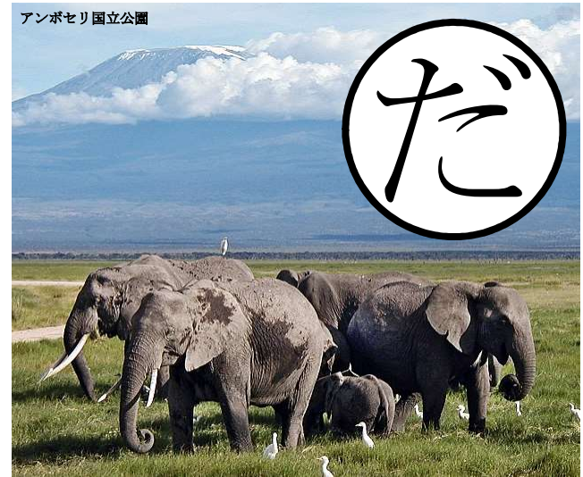
アンボセリ国立公園