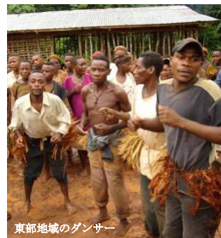
東部地域のダンス