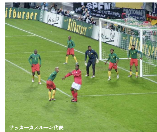
サッカーカメルーン代表