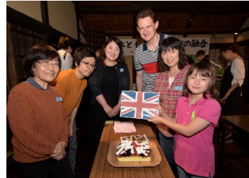
ユニオンジャックは 左右対称じゃない？