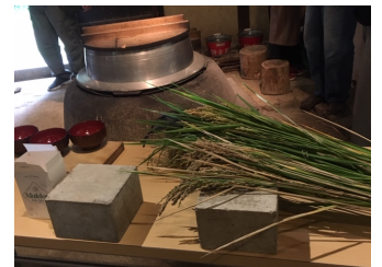
釜戸から立ち上る煙を見 ながら、炊き上がりを待 ちました。