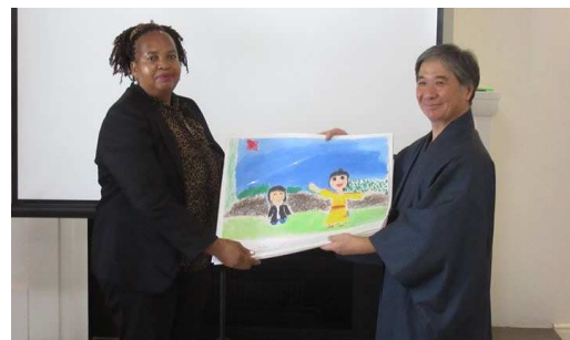
茅ヶ崎小学校の児童画がベン・テマ小へ

👉 在ボツワナ日本国大使館のFacebookで、レセプションの様子が紹介されています。ぜひご覧ください。