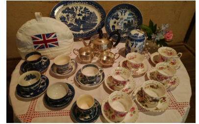
床の間には、ウィローパターンの ティーセットを飾りました。