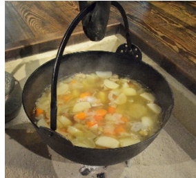
カウル ウェールズ風ビーフシチュー