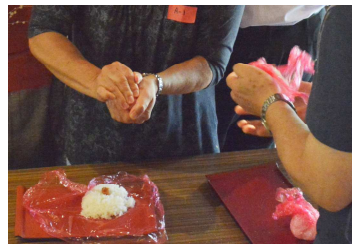
イギリスの塩と梅干しの おむすび、こころをこめて むすびました。