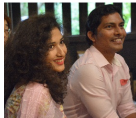
「子どもの頃に両親が お米を炊いていた様子 を思い出しました。」