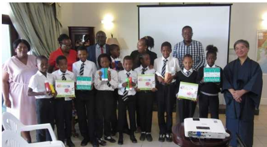
竹田大使と、寄贈された画材を手にするベン・テマ小学校の子どもたち

『都筑・ボツワナ交流児童画展』は、企業の協賛をいただいております。日本通運株式会社航空事業支店様には、第1回から毎年児童画の輸送をお引き受けいただいております。第6回となる今回は、ペンてる株式会社様より、絵の具、クレヨンのご提供をいただきました。これらの画材は、児童画とともに、10月17日に在ボツワナ日本国大使公邸で行われたレセプションで、竹田大使よりベン・テマ小学校の児童に手渡されました。