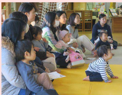
鴨池公園こどもログハウス Facebook より

2月6日（木）鴨池公園こどもログハウスで定期的に行われている「かもっこらぶ」に、MYプラザの日本語学習者が参加しました。タイ語で「はらぺこあおむし」を読みました。ちびっこたちもとても興味をもって聞いていました。