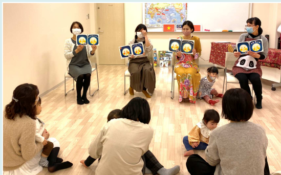
都筑区子育て支援センター Popola

2月13日都田小学校コミュニティハウス、2月19日都筑区子育て支援センターPopolaにて、親子向け多言語おはなし会を開催しました。都田小学校コミュニティハウスでは、日本語・ポルトガル語・韓国語で『はらぺこあおむし』を、Popolaでは、日本語・ベトナム語・マレー語・中国語で『おつきさまこんばんは』の読み聞かせをし、各国の紹介、手遊び、ダンスなどで参加者の親子と外国人ボランティアと一緒に楽しみました。ボランティアとして、MYプラザを利用している外国人が参加してくれました。