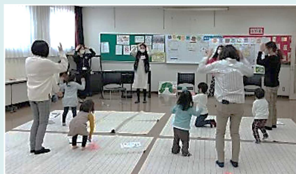
都田小学校コミュニティハウス