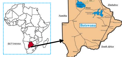
Map of Botswana:

6月30日(水)、茅ヶ崎小学校3年生を対象に国際理解教室を開催しました。佐藤都筑区長、駐日ボツワナ共和国ダニエル・カサ臨時代理大使のビデオメッセージのあと、MYプラザ林田館長からボツワナ共和国についてのお話がありました。理解を深めた子どもたちは、ボツワナの子どもたちに日本を知ってもらえるように、これから日本の生活についての絵を描いて送ります。