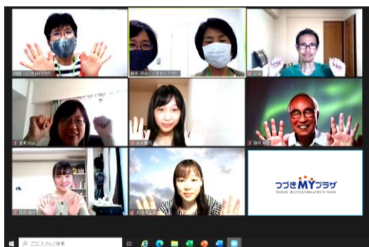
6月20日 オンライン講座

6月20日(日)〈オンライン〉・6月24日(木)〈対面〉で「ボランティア初心者のための勉強会」を開催しました。講師はMYプラザ林田館長。地域の日本語教室は、ボランティア、学習者ともに楽しめる場であること、学習者に寄り添いながらつなぐことの大切さ、学習者のやる気を引き出し、意欲を継続させること等々、日本語ボランティアの役割について学び合いました。