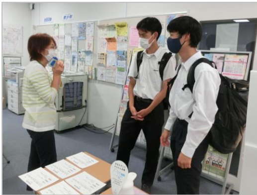
来館した青少年と気軽におしゃべり