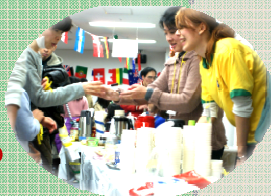
プラザまつりの開催