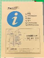
ウェルカムキット