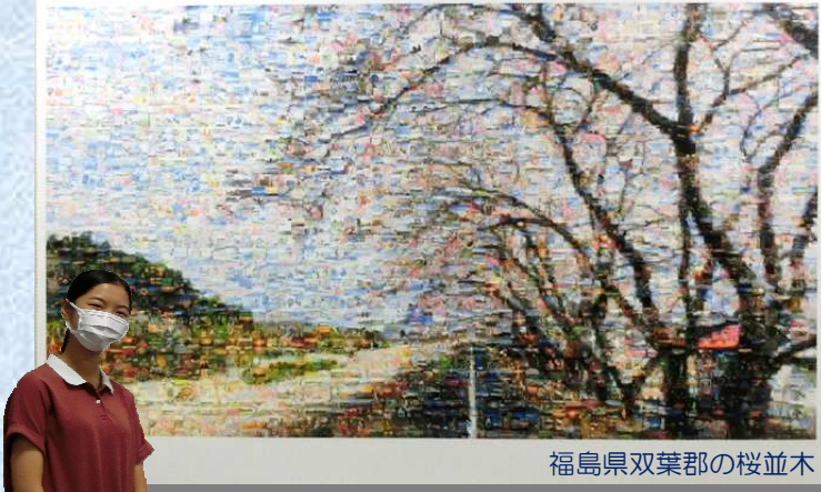
福島県双葉郡の桜並木