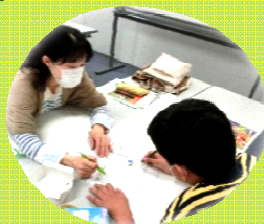
学習補習教室 KANJI クラブ