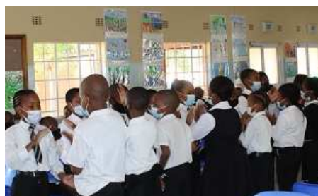
ベン・テマ小学校でのオープニングセレモニーの様子