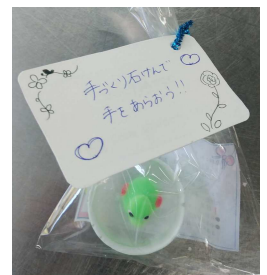
おもちゃが出てくるもの、カラフルでかわいい形のものなど工夫をこらした70個の石けん完成！