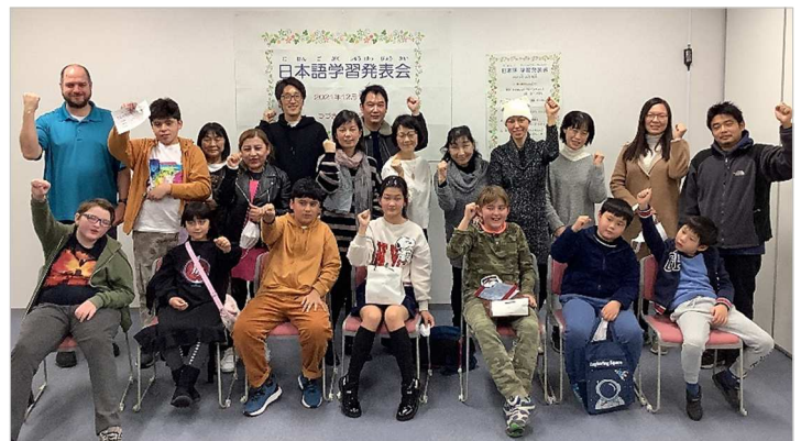
※写真撮影時のみ、マスクを外して撮影しました。

つづきMYプラザ(都筑多文化・青少年交流プラザ) 開館時間 平日：午前10時～午後9時 土日祝：午前10時～午後6時 休館日 第3月曜日(祝日の場合火曜日)、年末年始 アクセス 市営地下鉄ブルーライン・グリーンライン 「センター北」駅下車 徒歩3分 ノースポート・モール5階