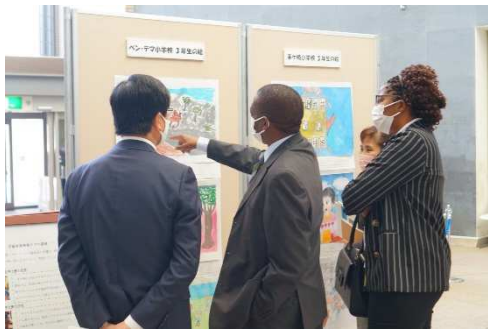
区長と共に両国の児童画を鑑賞