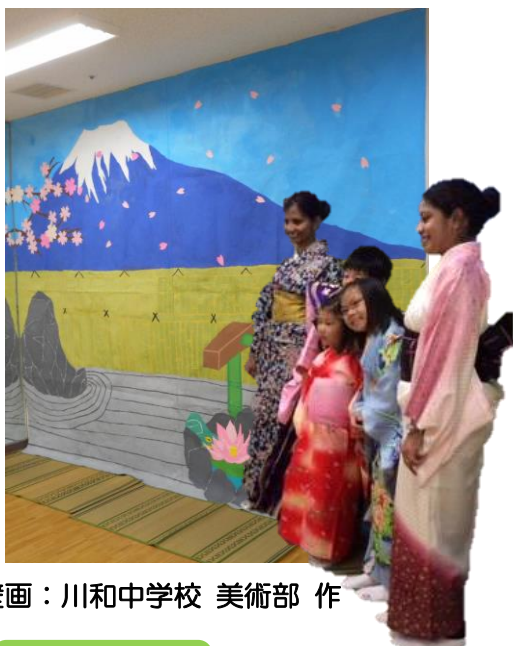
壁画：川和中学校 美術部 作