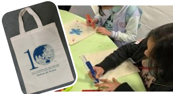
エコバッグづくり