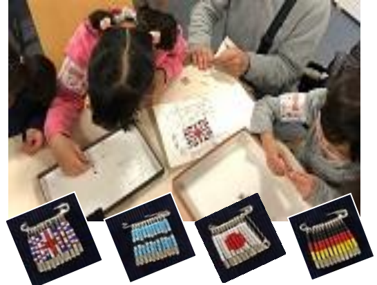
安全ピンピース国旗づくり