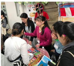
紫とうもろこしジュース ペルー