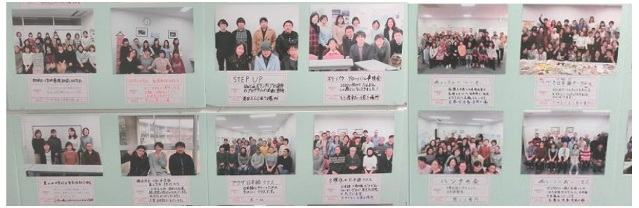
つながりの写真展