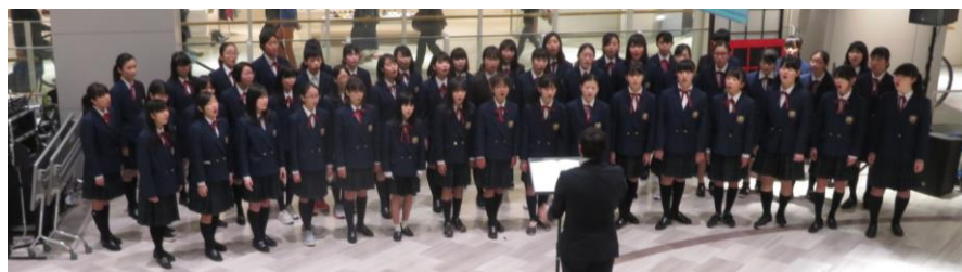
中川西中学校合唱部