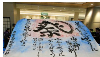
桂田高等学校書道部