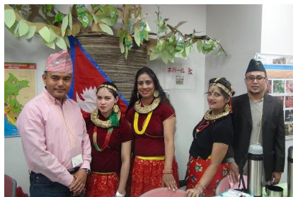
チャイとクッキー ネパール