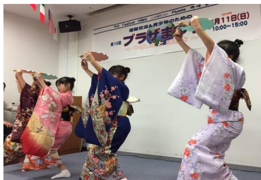
ちびっこ踊り（日本舞踊）