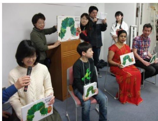
多言語おはなし会