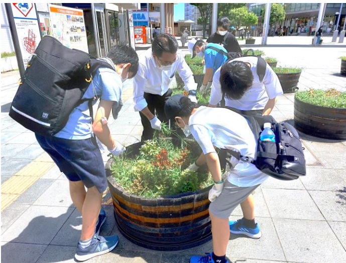
地域の方と一緒に花壇の草取り（昨年度の様子）

昨年は、小5から高3の324名が参加し、55のプログラムの中からボランティア活動をしました。今年は、新たに20以上のプログラムが加わっています。コロナ禍では受け入れが難しかった老人福祉施設や子育て支援施設、飲食を伴うイベントなども復活しました。関心のあるボランティア活動を見つけて参加しましょう。詳しくは、チラシ、MYプラザのホームページをご覧ください。