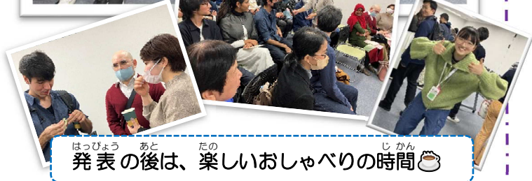
発表の後は、楽しいおしゃべりの時間🍵