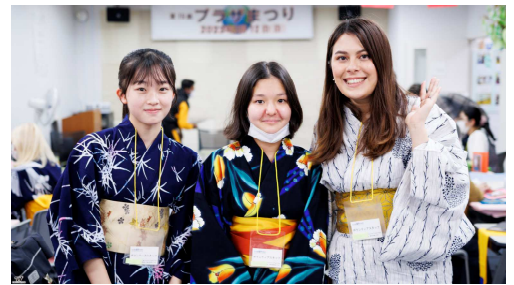
MY フラザのおまつりです