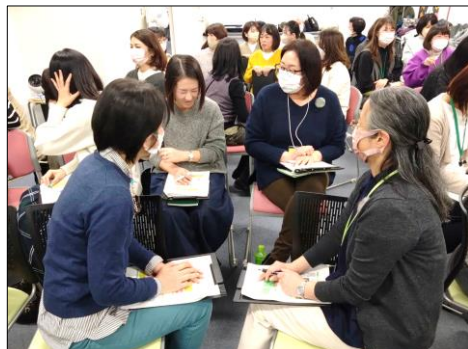
盛り上がったグループワーク