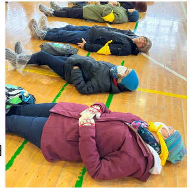
避難場所での、一人分のスペースを確認する参加者。

2月4日（日）川和東小学校地域防災拠点で防災訓練が行われ、区内で日本語を学ぶ外国人とボランティア計25名が参加しました。能登半島沖地震の影響もあり外国人はこの訓練にとっても関心を寄せていました。訓練後、参加者から「防災訓練に参加できたことは良かったが、言葉の壁を痛感した」との声がありました。防災訓練での気づきは、情報を伝える難しさです。「やさしい日本語」を活用するなど、取り組みが必要だと感じました。今回の訓練のおかげで、ひとつ課題が見えてきました。今後につなげます。