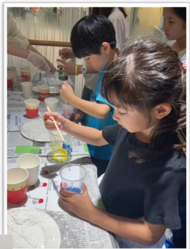
スライムづくりや新聞紙でジャバラ虫も作りました。