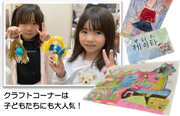
クラフトコーナーは子どもたちにも大人気！