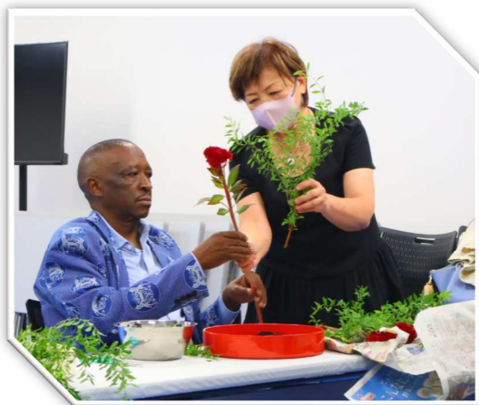
生け花がお気に入りのポツワナ大使