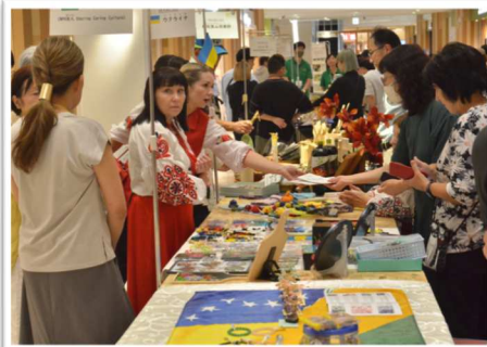
マルシェは、たくさんのお客様でにぎわいました。