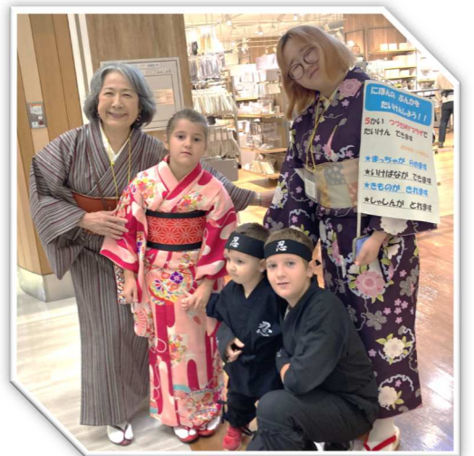
『やさしいにほんご ツアー』で、2階のマルシェまで着物を着てお出かけ

つつきMY プラザ（都筑多文化・青少年交流プラザ） 開館時間 平日：午前10時～午後8時 土日祝：午前10時～午後6時 休館日 第3月曜日（祝日の場合火曜日）、年末年始 アクセス 市営地下鉄ブルーライン・グリーンライン「センター北」駅下車 徒歩3分 ノースポート・モール5階