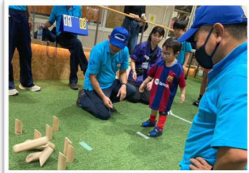
モルックやターゲットポッチャ体験