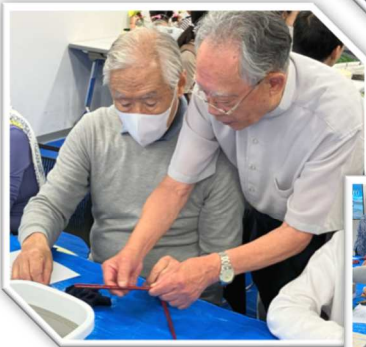
塗り箸研ぎ体験 世界にたった一つの MY はし