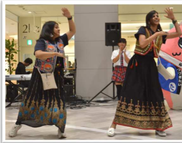
ステージは、会場と演者が一体となって大盛り上がり！

10月6日、第2回 DE&I フェスティバルを開催しました。誰もが自分らしく、そしてどこにも線引きのない世界を目指して、参加者みんなで楽しんだフェスティバル。46団体の参加者と、433名のボランティア。4,000人を超える方々にご来場いただきました。一人ではできないことも、みんなでやれば楽しく、それぞれの活躍が広がった一日でした。体験して共感する。これからもそんな地域づくりを目指します。