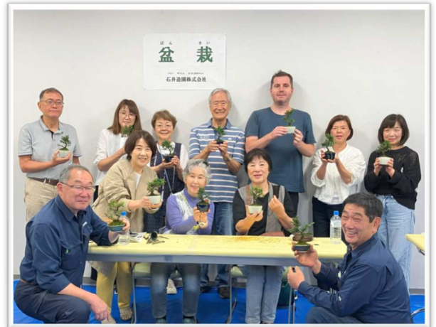
自信作の BONSAI を手にハイポーズ！