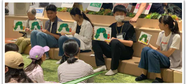
多言語おはなし会では5か国語で絵本の読み聞かせをしました。