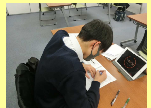
黙々と勉強。疲れたらスタッフとおしゃべり