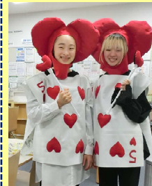
ラウンジで友達とハロウィンの衣装づくり