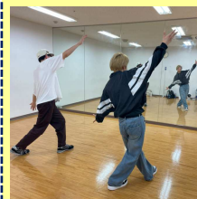
ダンススタジオで踊る