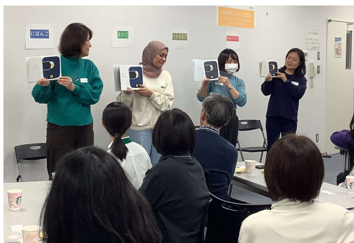
日本語、英語、ベトナム語、中国語で「多言語おはなし会」実演

外国人の増加で多言語対応が必要となる中、3月20日、ボランティア活動の活性化を目的に交流会を開催しました。活動経験の共有や実情の紹介、活動の一つである「多言語おはなし会」を紹介し、参加者のモチベーションアップにも繋がったようでした。スターバックスコーヒージャパン様のご協賛により、美味しいコーヒーが提供され、リラックスした雰囲気の中で交流が深まりました。「エシカルなコーヒー」についてご紹介いただき、社会貢献の視点からも、ボランティア活動との共通点を知る機会となりました。