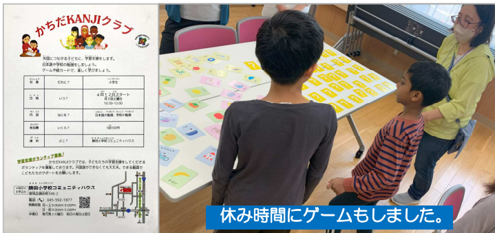
休みに時間にゲームもしました。

今までは、MY プラザまで1時間歩いて勝田方面から来ていた子ども達も、近くに学べる場所ができて喜んでいました。MY プラザがちょっと遠いという子やボランティアを始めたい方、是非、「かちだ KANJI クラブ」へ行ってみてください！