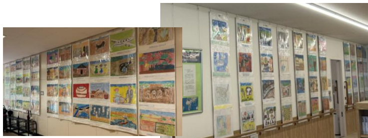
東山田中学校 コミュニティハウス

TICAD9関連事業として、過去11年分の児童画を、都筑区内の地区センターやコミュニティハウスなどで展示しました。来場者からは、「動物の絵は、躍動感を感じる」「初期の絵は色が少なかったけど、色が豊富になってきている」「絵の変遷をたどると、描いている内容が違って面白かった」「文化の違いを感じる」「知らなかったボツワナを身近に感じた」など、さまざまな感想をいただき、延べ6,500人以上の方々が楽しんでくださいました。8月には、追加展示として子育て支援センターポポラに展示いたします。