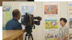
ボッシュ ホール 都筑区民文化センター ギャラリー