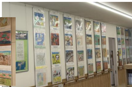
都田地区センター・ 都田地域ケアプラザ